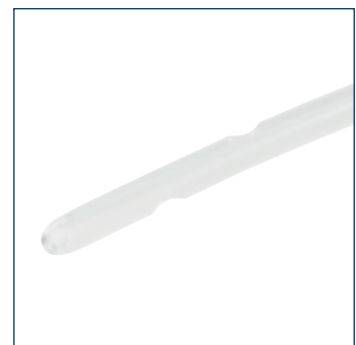
Seitlich versetzte Augen